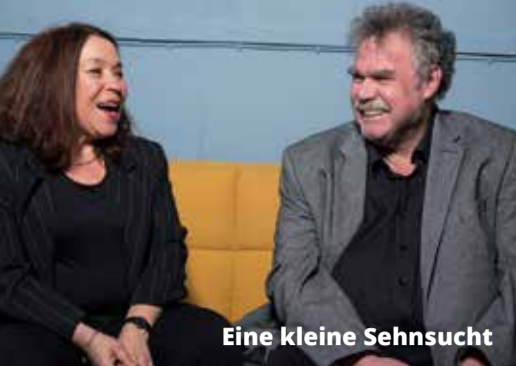
Eine kleine Sehnsucht